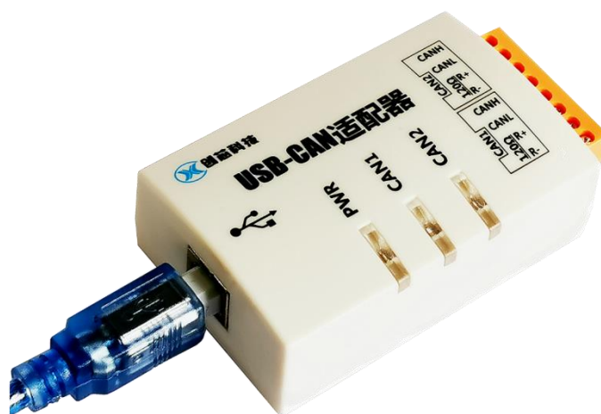
图 1 USBCAN 系列产品外形图(具体以实物为准)